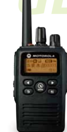
携帯性と通信範囲のバランス型