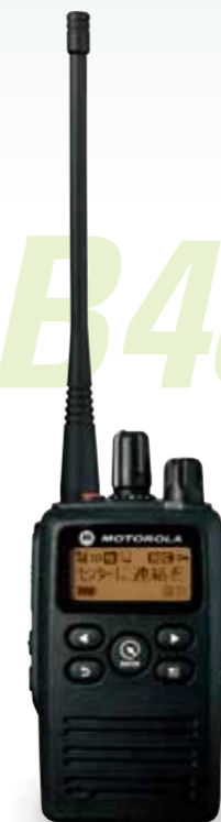
広範囲での通信に