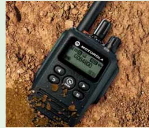
粉塵の侵入から保護されていること。