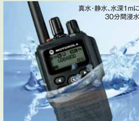
規定の圧力・時間で水中に没しても動作に影響がないこと。

※製品本体の防水性能を維持するためには、異常の有無に関わらず保証期間経過後、年に一度のメンテナンス(有料)をお勧めします。(IPとは、異物と水の浸入に対する保護を規格化したもので、IECの規格で規定されている機器の保護等級を記号で示したものです)