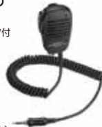
MH-57A4B スピーカーマイク 本体価格4,700円(税抜)