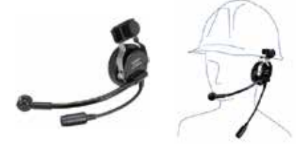
SSM-60H スポーツ/工事ヘルメット用ヘッドセット 本体価格13,200円(税抜)

ヘルメットに装着するタイプのヘッドセット ※本体との接続にはSCU-11が必要です。