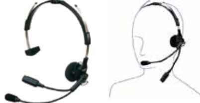
SSM-62H インターコム型ヘッドセット 本体価格4,800円(税抜)

ヘルメットに装着するタイプのヘッドセット ※本体との接続にはSCU-11が必要です。