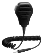
MH-73A4B 防浸型スピーカーマイク 本体価格5,200円(税抜)