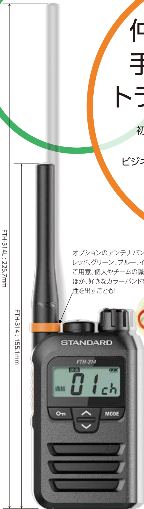
原寸大 (バックはロング アンテナモデル)

本製品はオーディオコネクタのキャップを開めた状態でIP67となり、それ以外の場合IP65となります。