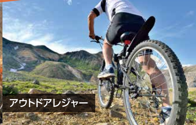
アウトドアレジャー