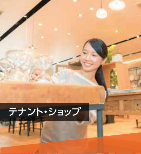
テナント・ショップ