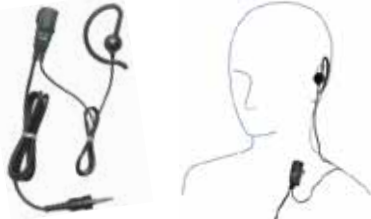
MH-381A4B 小型タイプピンマイク(耳かけイヤホンタイプ) 本体価格 3,800円(税抜)